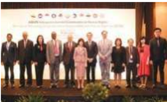
ກອງປະຊຸມສຳມະນາ AICHR ກ່ຽວກັບ ການສົ່ງເສີມການມີສ່ວນຮ່ວມຮັບຜິດຊອບ ໃນສັງຄົມ (CSR) ແລະ ສິດທິມະນຸດ ໃນອາຊຽນ, 3-4 ພະຈິກ 2016, ສິງກະໂປ