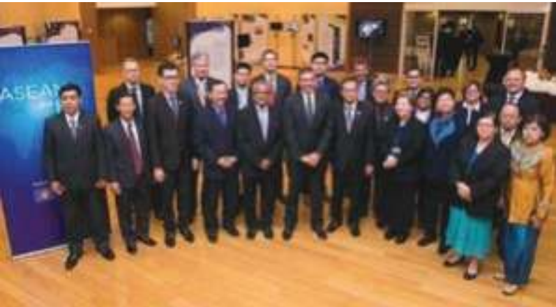
ຜູ້ຕາງໜ້າອາຊຽນທີ່ກອງປະຊຸມສົນທະນາກ່ຽວກັບນະໂຍບາຍ ດ້ານສິດທິມະນຸດອາຊຽນ-ອີຢູ