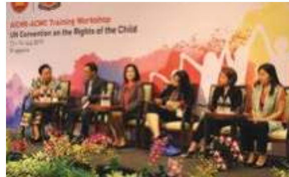
ກອງປະຊຸມຝຶກອົບຮົມ AICHR-ACWC ກ່ຽວກັບ ສົນທິສັນຍາສິດທິເດັກ ສປຊ (UN CRC), 13-14 ກໍລະກົດ 2017, ສິງກະໂປ