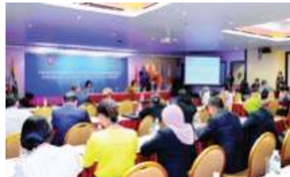
ກອງປະຊຸມ AICHR ກ່ຽວກັບ ການສື່ສານຍຸດທະສາດທີ່ມີປະສິດທິພາບ ເພື່ອດ້ານການຄ້າມະນຸດ, 23-24 ມິຖຸນາ 2016, ຍາຈາງ, ຫວຽດນາມ