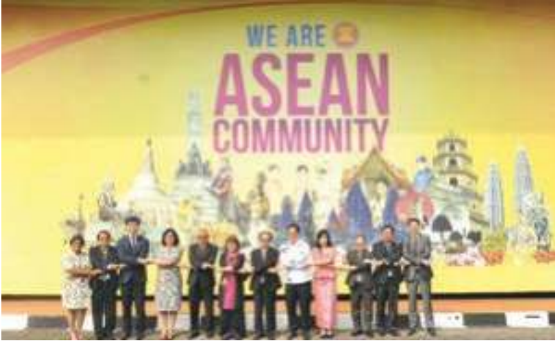
ກອງປະຊຸມ AICHR ຄັ້ງທີ 24 th ທີ່ກອງເລຂາອາຊຽນ

ໃນໄລຍະຜ່ານມາ ໄດ້ມີການຮ່ວມມືກັບຫຼາຍຂະແໜງການ ແລະ ຫຼາຍເສົາຄໍ້າ ເພື່ອຮັບປະກັນວ່າສິດທິມະນຸດໄດ້ຖືກໃຫ້ຄວາມສໍາຄັນໃນທັງ 03 ເສົາຄໍ້າຂອງອາຊຽນ. ກອງປະຊຸມຄັ້ງທໍາອິດ ກ່ຽວກັບ ການປຶກສາຫາລືລະຫວ່າງ AICHR - SOMTC ວ່າດ້ວຍ ວິທີການພື້ນຖານດ້ານສິດທິມະນຸດ ເພື່ອຈັດຕັ້ງປະຕິບັດສິນທິສັນຍາອາຊຽນວ່າດ້ວຍການຕ້ານການຄ້າມະນຸດ, ໂດຍສະເພາະແມ່ຍິງ ແລະ ເດັກນ້ອຍ.