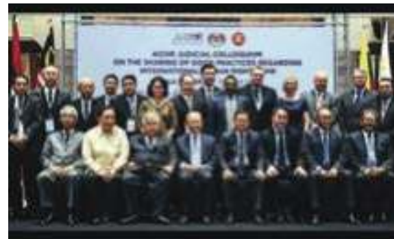
ກອງປະຊຸມ ອົງການຕຸລາການ AICHR ກ່ຽວກັບ ການແລກປ່ຽນການປະຕິບັດກົດໝາຍ ວ່າດ້ວຍ ສິດທິມະນຸດສາກົນ ຕົວຈິງທີ່ຕີທໍ່ສູດ, 13-15 ມີນາ 2017, ກົວລາລຳເປີ, ມາເລເຊຍ