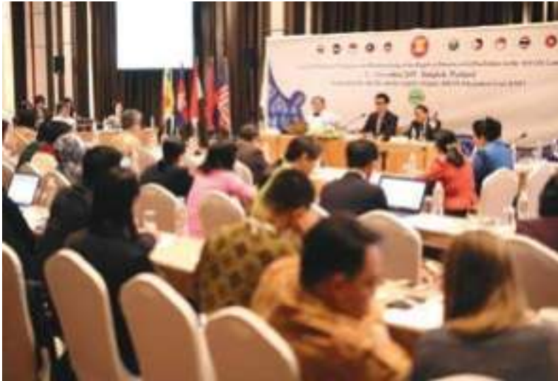
ບົດສົນທະນາພາກພື້ນຂອງ AICHR ກ່ຽວກັບ ການຊ່ວຍໜູນສິດທິຂອງຄົນພິການໃນປະຊາຄົມອາຊຽນ