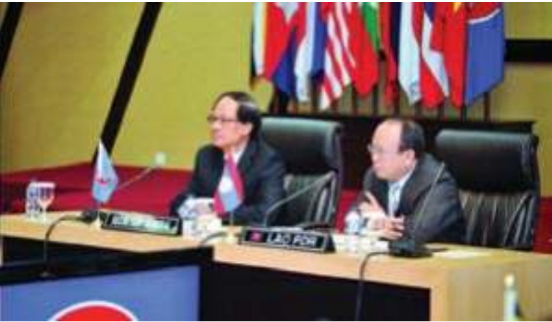
ກອງປະຊຸມ AICHR ຮ່ວມກັບ ເລຂາທິການອາຊຽນ

ຮັບການຮັບຮອງໃນເດືອນກໍລະກົດ 2009 ໂດຍລັດຖະມົນຕີການຕ່າງປະເທດອາຊຽນ, AICHR ບໍ່ມີພັນທະໃນການຮັບຜິດຊອບກໍລະນີທີ່ເປັນບຸກຄົນ.