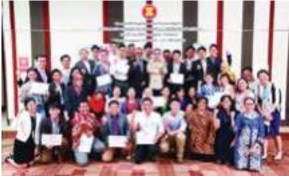
ໂຄງການ AICHR ກ່ຽວກັບ ສິດທິມະນຸດ: ຝຶກອົບຮົມຄູຝຶກສໍາລັບນັກຂ່າວ ໃນປະເທດສະມາຊິກອາຊຽນ, 25-29 ກໍລະກົດ 2015, ບາງກອກ, ໄທ