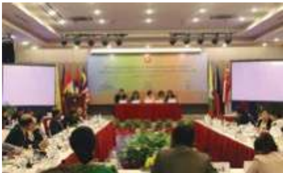
ກອງປະຊຸມພາກພື້ນ AICHR ກ່ຽວກັບ ການສ້າງຄວາມເຂັ້ມແຂງແຜນການປະຕິບັດ ງານແຫ່ງຊາດ ກ່ຽວກັບການຄ້າມະນຸດ ເພື່ອຮັບປະກັນການຈັດຕັ້ງປະຕິບັດສິນທິ ສັນຍາດ້ານການຄ້າມະນຸດ, ໂດຍສະເພາະແມ່ຍິງ ແລະ ເດັກນ້ອຍອາຊຽນ (ACTIP) ແລະ ແຜນປະຕິບັດງານດ້ານການຄ້າມະນຸດ, ໂດຍສະເພາະແມ່ຍິງ ແລະ ເດັກນ້ອຍ ອາຊຽນ (APA) ໃຫ້ມີຄຸນນະພາບ, 1-2 ທັນວາ 2016, ພະນົມເປັນ, ກຳປູເຈຍ