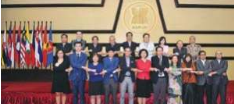
AICHR ແລະ ຄະນະກຳມາທິການຜູ້ຕາງໜ້າຖາວອນ (CPR) ຂອງອາຊຽນ

ອົງປະກອບຂອງສິດທິມະນຸດ, ທີ່ໄດ້ບັນຍັດໃນແຜນງານວຽງຈັນ ປີ 2004 ໄດ້ຖືກຍ້າຍຄືນ ໃນແຜນປະຕິບັດງານພາຍໃຕ້ປະຊາຄົມການເມືອງ-ຄວາມໝັ້ນຄົງ (APSC) ປີ 2009-2015, ພາກ A.1.5. “ການສົ່ງເສີມ ແລະ ປົກປ້ອງສິດທິມະນຸດ”, ປະກອບມີແຜນວຽກ 07 ຢ່າງ.