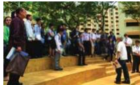
ການໂຕ້ວາທີ AICHR ກ່ຽວກັບ ສິດທິມະນຸດ, 5-6 ກັນຍາ 2015, ສິງກະໂປ