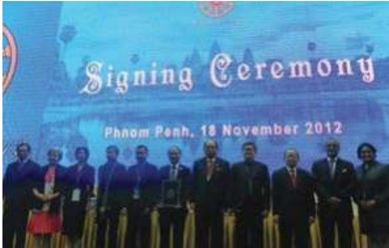
ຜູ້ຕາງໜ້າ AICHR ໃນພິທີເຊັນ ຖະແຫຼງການພະນົມເປັນ ກ່ຽວກັບ ການຮັບຮອງ ຖະແຫຼງການສິດທິມະນຸດອາຊຽນ AHRD

ມາດຕາ 4.2 ຂອງພາລະບົດບາດຂອງຖະແຫຼງການສິດທິມະນຸດອາຊຽນ “AICHR” ກຳນົດວ່າ AICHR ມີພັນທະໃນການປັບປຸງຖະແຫຼງການສິດທິມະນຸດ ( AHRD ) ດ້ວຍທັດສະນະໃນການສ້າງຂອບວຽກສໍາລັບການຮ່ວມມືທາງດ້ານສິດທິມະນຸດໂດຍຜ່ານຫຼາຍກອງປະຊຸມອາຊຽນ ແລະ ເຄື່ອງມືອື່ນໆທີ່ກ່ຽວຂ້ອງກັບສິດທິມະນຸດ.