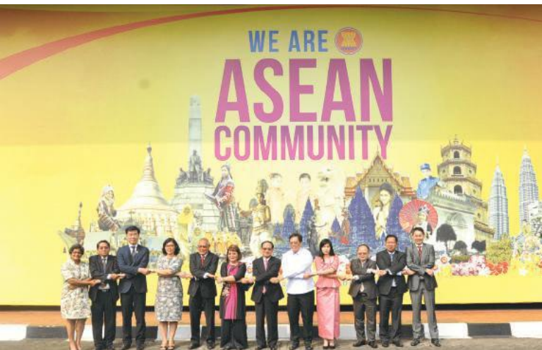
การประชุม AICHR ครั้งที่ 24 ณ สำนักเลขาธิการอาเซียน

เรื่องของสิทธิของคนพิการก็ถือเป็นหัวข้อสำคัญของ AICHR เช่นกัน AICHR พร้อม ความร่วมมือกับการประชุมเจ้าหน้าที่อาวุโสด้าน สวัสดิการสังคมและการพัฒนา (SOMSWD) และคณะกรรมการ อาเซียนว่าด้วยการส่งเสริมและคุ้มครองสิทธิสตรีและสิทธิเด็ก (ACWC) ได้ก่อตั้งคณะทำงานด้านการบูรณาการสิทธิของคนพิการในประชาคม อาเซียน พร้อมกับข้อบังคับในการร่างแผนปฏิบัติการระดับภูมิภาคใน เรื่องของความพิการ ซึ่ง การก่อตั้งคณะทำงานนี้นับเป็นความร่วมมือ ครั้งแรกระหว่างประชาคมการเมืองความมั่นคงอาเซียน และเสา ประชาคมสังคมและวัฒนธรรมอาเซียนในเรื่องของความพิการ