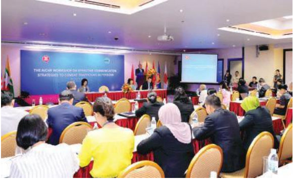
การประชุมเชิงปฏิบัติการของ AICHR ในเรื่องกลยุทธ์ในการสื่อสารอย่างมีประสิทธิภาพเพื่อต่อสู้กับการค้ามนุษย์ เมื่อวันที่ 23-24 มิถุนายน พ.ศ. 2559 ณ เมืองญาจาง ประเทศเวียดนาม