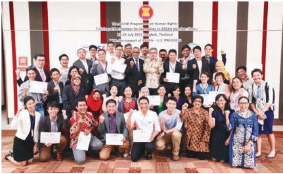
โครงการด้านสิทธิมนุษยชนของ AICHR การฝึกอบรมผู้ฝึกสอนสำหรับนักข่าวในประเทศสมาชิก อาเซียน วันที่ 25-29 กรกฎาคม พ.ศ. 2558 ณ กรุงเทพมหานคร ประเทศไทย