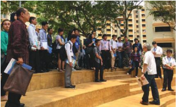
การได้วาที่ระดับเยาวชนของ AICHR ในเรื่องสิทธิมนุษยชน เมื่อวันที่ 5-6 กันยายน ปี 2015 (พ.ศ. 2558) ณ ประเทศสิงคโปร์