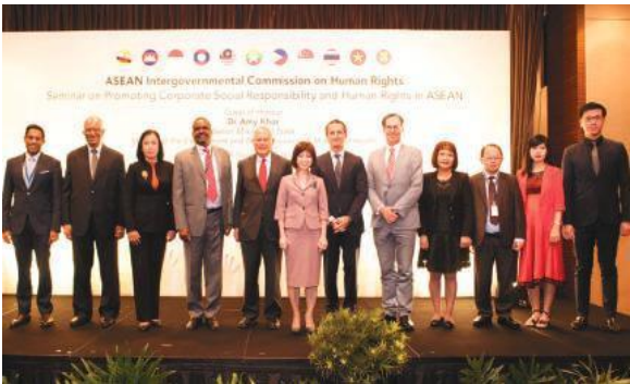
งานสัมมนา AICHR เรื่องการส่งเสริมความรับผิดชอบต่อสังคม (CSR) และ สิทธิมนุษยชน ในอาเซียน เมื่อวันที่ 3-4 พฤศจิกายน พ.ศ. 2559 ณ ประเทศสิงคโปร์