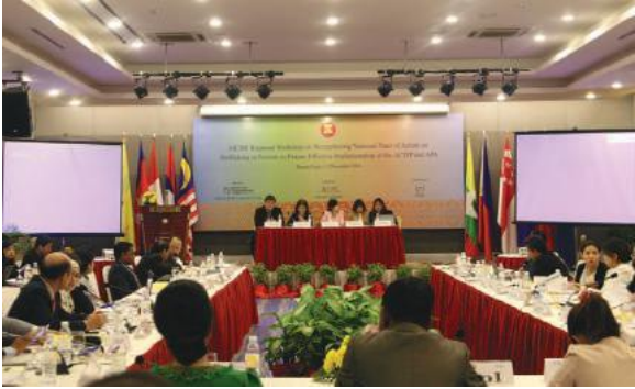
การประชุมเชิงปฏิบัติการระดับภูมิภาคของ AICHR ในเรื่องการเสริมสร้างแผนปฏิบัติการระดับชาติด้านการคุ้มครองสิทธิมนุษยชนเพื่อสร้างความมั่นใจการดำเนินการตามอนุสัญญาอาเซียนว่าด้วยการต่อต้านการค้ามนุษย์ โดยเฉพาะสตรีและเด็ก (ACTIP) และแผนปฏิบัติการอาเซียนว่าด้วยการต่อต้านการค้ามนุษย์ โดยเฉพาะสตรีและเด็ก (APA) อย่างมีประสิทธิภาพ เมื่อวันที่ 1-2 ธันวาคม พ.ศ. 2559 ณ กรุงเทพมหานคร